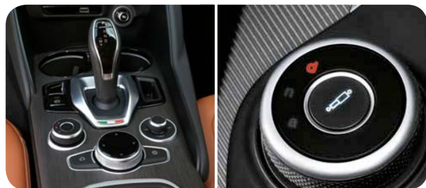
Nowa konsola środkowa, system Alfa DNA z wybranym trybem Dynamic

■ standard; P - dostępne w pakiecie; - opcja niedostępna