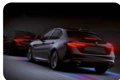
System ostrzegania przed najechaniem na pojazd poprzedzający z funkcją autonomicznego hamowania awaryjnego

Cennik zawiera ceny detaliczne brutto w złotych zawierające podatek VAT. Ceny zawierają podatek akcyzowy. Ceny mogą ulec zmianom bez uprzedniego zawiadomienia w przypadku zmian cen przez producenta, zmian podatkowych, przepisów celnych lub innych przyczyn. Wypożyczenie seryjne i dodatkowe poszczególnych modeli może ulegać zmianom w zależności od potrzeb poszczególnych rynków i wymogów prawnych. Dane w niniejszym cenniku mają charakter orientacyjny i nie stanowią oferty w rozumieniu Kodeksu Cywilnego.