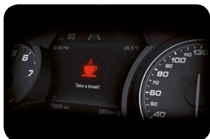
System ostrzegania o zmęczeniu kierowcy