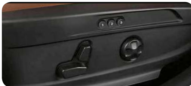
Pakiet Elektryczne fotele z pamięcią ustawień

Cennik zawiera ceny detaliczne brutto w złotych zawierające podatek VAT. Ceny zawierają podatek akcyzowy. Ceny mogą ulec zmianom bez uprzedniego zawiadomienia w przypadku zmian cen przez producenta, zmian podatkowych, przepisów celnych lub innych przyczyn. Wypożyczenie seryjne i dodatkowe poszczególnych modeli może ulegać zmianom w zależności od potrzeb poszczególnych rynków i wymogów prawnych. Dane w niniejszym cenniku mają charakter orientacyjny i nie stanowią oferty w rozumieniu Kodeksu Cywilnego.