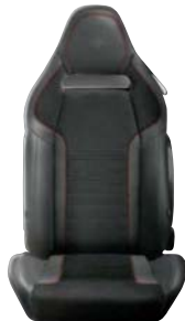
Czarne Sparco (opcja)

Cennik zawiera ceny detaliczne brutto w złotych zawierające podatek VAT. Ceny zawierają podatek akcyzowy. Ceny mogą ulec zmianom bez uprzedniego zawiadomienia w przypadku zmian cen przez producenta, zmian podatkowych, przepisów celnych lub innych przyczyn. Wyposażenie seryjne i dodatkowe poszczególnych modeli może ulegać zmianom w zależności od potrzeb poszczególnych rynków i wymogów prawnych. Dane w niniejszym cenniku mają charakter orientacyjny i nie stanowią oferty w rozumieniu Kodeksu Cywilnego.