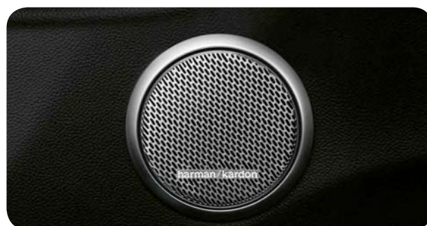
System HI FI by Harman Kardon

Cennik zawiera ceny detaliczne brutto w złotych zawierające podatek VAT. Ceny zawierają podatek akcyzowy. Ceny mogą ulec zmianom bez uprzedniego zawiadomienia w przypadku zmian cen przez producenta, zmian podatkowych, przepisów celnych lub innych przyczyn. Wyposażenie seryjne i dodatkowe poszczególnych modeli może ulegać zmianom w zależności od potrzeb poszczególnych rynków i wymogów prawnych. Dane w niniejszym cenniku mają charakter orientacyjny i nie stanowią oferty w rozumieniu Kodeksu Cywilnego.