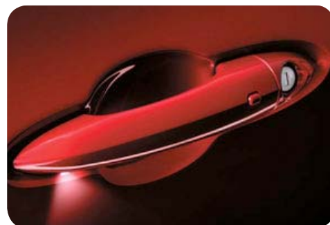
Bezkluczkowe otwarcie drzwi - Keyless Entry

Cennik zawiera ceny detaliczne brutto w złotych zawierające podatek VAT. Ceny zawierają podatek akcyzowy. Ceny mogą ulec zmianom bez uprzedniego zawiadomienia w przypadku zmian cen przez producenta, zmian podatkowych, przepisów celnych lub innych przyczyn. Wypożyczenie seryjne i dodatkowe poszczególnych modeli może ulegać zmianom w zależności od potrzeb poszczególnych rynków i wymogów prawnych. Dane w niniejszym cenniku mają charakter orientacyjny i nie stanowią oferty w rozumieniu Kodeksu Cywilnego.