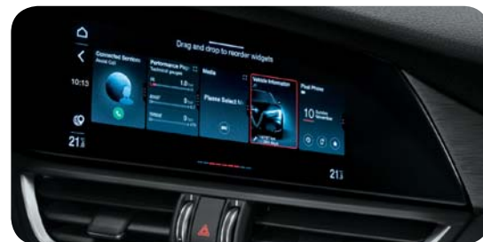
Nowy system multimedialny z wyświetlaczem dotykowym 8,8" w standardzie

Cennik zawiera ceny detaliczne brutto w złotych zawierające podatek VAT. Ceny zawierają podatek akcyzowy. Ceny mogą ulec zmianom bez uprzedniego zawiadomienia w przypadku zmian cen przez producenta, zmian podatkowych, przepisów celnych lub innych przyczyn. Wypożyczenie seryjne i dodatkowo wyposażenie poszczególnych modeli może ulegać zmianom w zależności od potrzeb poszczególnych rynków i wymogów prawnych. Dane w niniejszym cenniku mają charakter orientacyjny i nie stanowią oferty w rozumieniu Kodeksu Cywilnego.