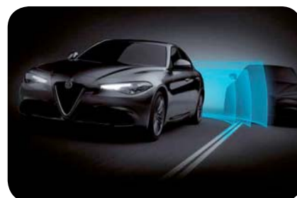
Aktywne monitorowanie martwego pola