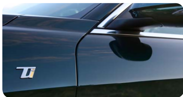
Wersja wyposażenia Ti wyróżnia się detalami nadwozia