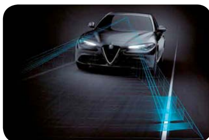
Asystent pasa ruchu