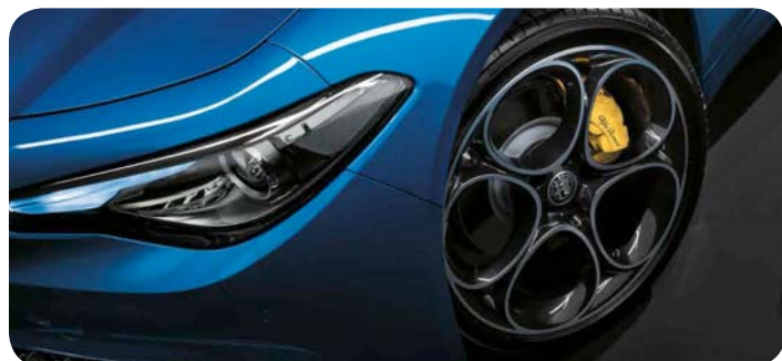
Zaciski hamulców lakierowane w kolorze: czarnym, czerwonym lub żółtym

■ standard; P - dostępne w pakiecie; - opcja niedostępna