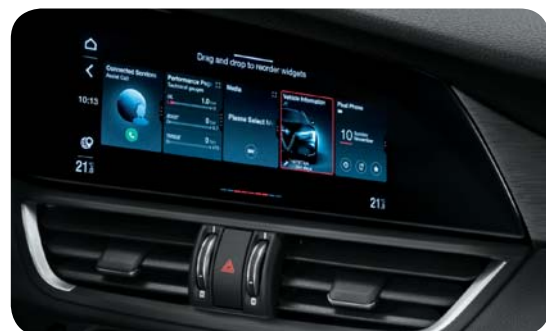
Nowy system multimedialny z wyświetlaczem dotykowym 8,8" w standardzie

Cennik zawiera ceny detaliczne w złotych z VAT. Ceny zawierają podatek akcyzowy. Ceny mogą ulec zmianom bez uprzedniego zawiadomienia w przypadku zmian cen przez producenta, zmian podatkowych, przepisów celnych lub innych przyczyn. Wyposażenie seryjne i dodatkowe poszczególnych modeli może ulegać zmianom w zależności od potrzeb poszczególnych rynków i wymogów prawnych. Dane w niniejszym cenniku mają charakter orientacyjny i nie stanowią oferty w rozumieniu Kodeksu Cywilnego.