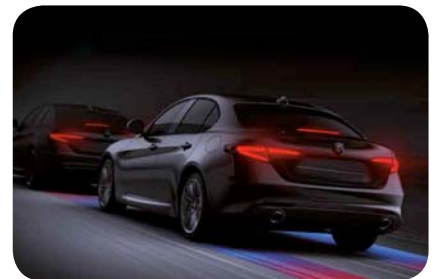
System ostrzegania przed najechaniem na pojazd poprzedzający z funkcją autonomicznego hamowania awaryjnego

Cennik zawiera ceny detaliczne w złotych z VAT. Ceny zawierają podatek akcyzowy. Ceny mogą ulec zmianom bez uprzedniego zawiadomienia w przypadku zmian cen przez producenta, zmian podatkowych, przepisów celnych lub innych przyczyn. Wypożyczenie seryjne i dodatkowe poszczególnych modeli może ulegać zmianom w zależności od potrzeb poszczególnych rynków i wymogów prawnych. Dane w niniejszym cenniku mają charakter orientacyjny i nie stanowią oferty w rozumieniu Kodeksu Cywilnego.