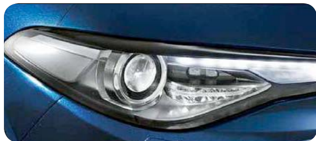
Pakiet Lighting (światła bi-ksenonowe ze spryskiwaczami)