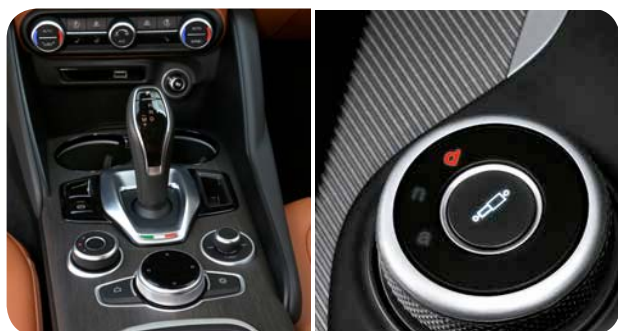
Nowa konsola środkowa, system Alfa DNA z wybranym trybem Dynamic

■ standard; P - dostępne w pakiecie; - opcja niedostępna