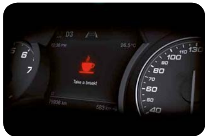
Asystent uwagi kierowcy