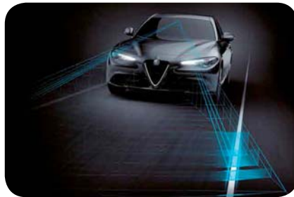
Asystent pasa ruchu