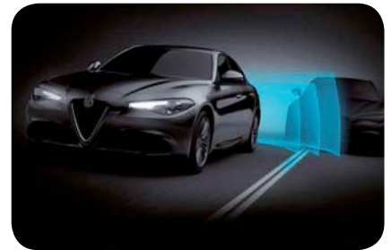
Aktywne monitorowanie martwego pola