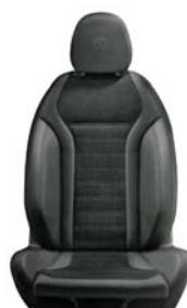
497 / 017 / 027 Czarne