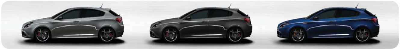
318 Grigio Stromboli