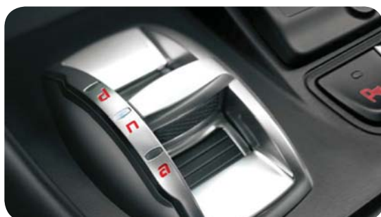
System Alfa DNA - selektor wyboru trybu jazdy

■ => opcja znajdująca się w standardzie P => opcja dostępna tylko w pakiecie - => opcja niedostępna