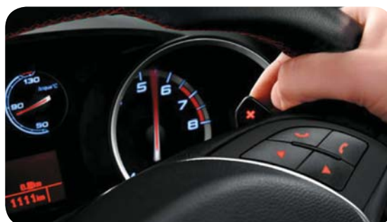
Łopatki w kolumnie kierownicy do zmiany biegów do skrzyni automatycznej Alfa TCT