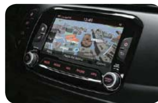
Nawigacja Uconnect™ z dotykowym wyświetlaczem 6,5" (6ZB)