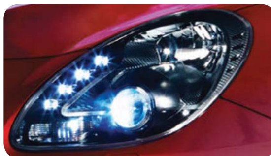
Reflektory bi-ksenonowe z funkcją AFS