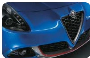
Wykończenie dołu zderzaka przedniego w stylizacji Carbon z czerwonymi akcentami (09K)