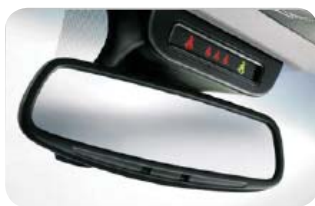
Elektrochromatyczne lusterko wewnętrzne (525)