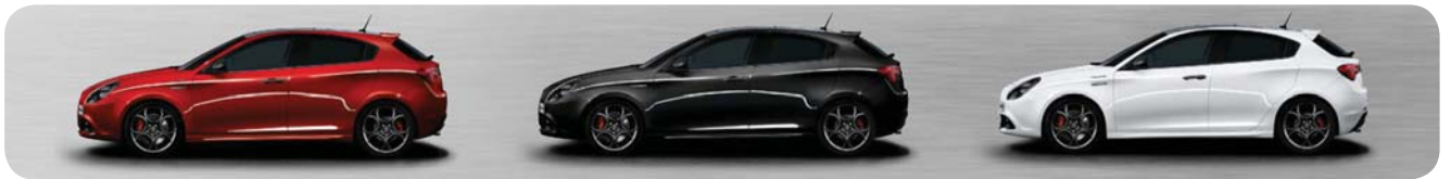
414 Rosso Alfa