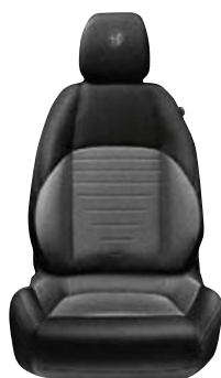
Czarna / szara 198