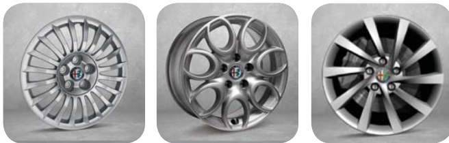
404 GIULIETTA (STD)