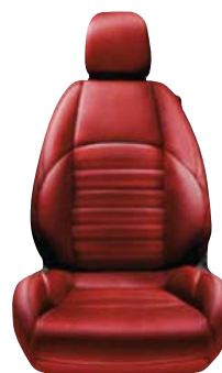
Czerwona 401 / 901