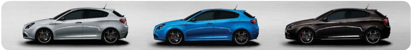
620 Grigio Silverstone