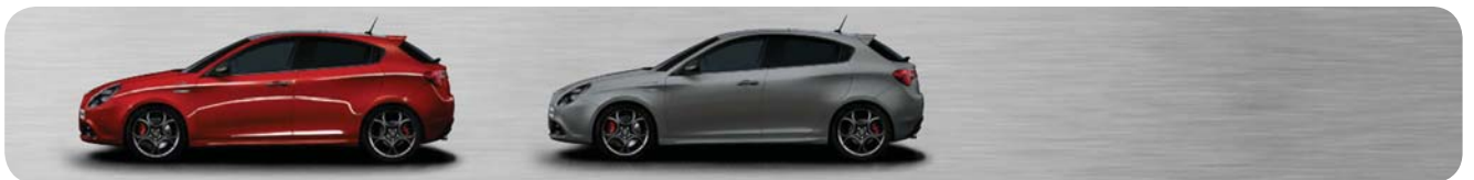
361 Rosso Competizione