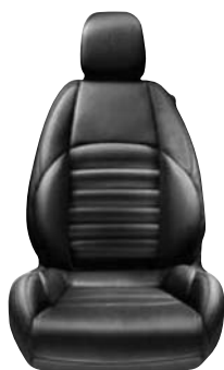
Czarna 408 / 402 / 923